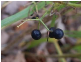
果実 2013.11.9 e