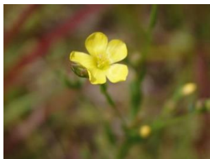
2014.9.16 e キバナノマツバニンジン (黄花松葉人參)