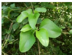
葉 2012.8.17 e