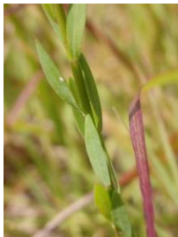
葉 2014.9.16 e 北アメリカ原産の帰化植物。