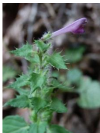
刺状の鋸歯 2012.9.7 e

ママコナは茎の先につく苞 ほう に刺 状の鋸歯 きよし があるが、刺状の鋸歯 がないのはミヤマママコナ。