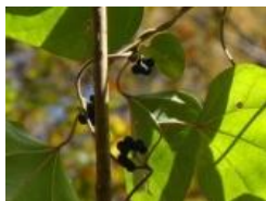
果実 2011.11.1 e