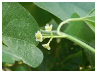
雄花 2012.8.17 e