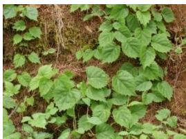
地面を這う葉 2015.5.23 e