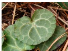
葉 2011.3.16 e