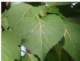
木に登った葉 2014.9.14 e

幼木は地面を這うように生え、幹や枝から気根 きこん を出して木や岩を這い上がる。