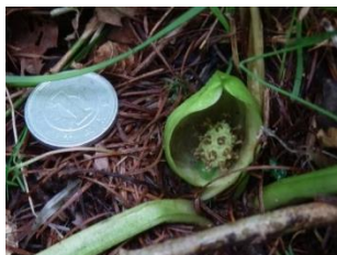
一円玉と花 2012.7.6 e ミドリヒメザゼンソウ (緑姫座禅草)