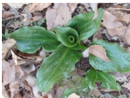
葉 2014.4.27 e

★e 春一番に葉を広げるので、 見つけたら観察を続ければ、きつ と花も見られます。