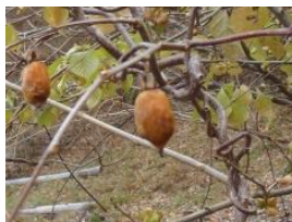
果実 2013.11.12 k

雄花、雌花、両性花がある。 葉の先が白くなる。標高の高いと ころに生えるミヤママタタビの葉 は白にピンクが加わる。