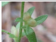
果実 2014.6.6 e