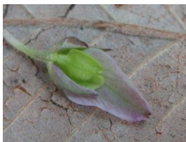
若い果実 2014.5.20 e

★e 花の珊瑚 さんご のような房状の白いものは単なる附属体なのだそうです。何のために付けているんでしょうね。