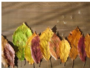
コナラの葉、タンポポの種で風景画 y