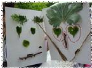
葉っぱで顔を描く