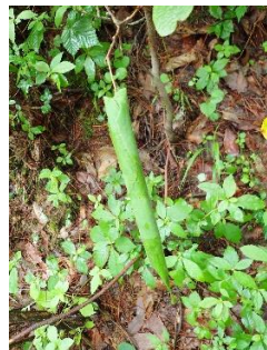
ハクウンボクの揺籃